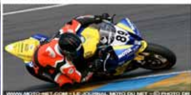
www.moto-net.com - LE JOURNAL MOTO DU NET - © PHOTO ENI